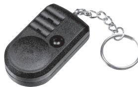
Рис. 1. Внешний вид приемника

После того, как вы услышали тревожный сигнал и определили тип тревоги, нажмите кнопку на корпусе приемника, чтобы сбросить индикацию. Эта же кнопка используется для управления работой приемника.